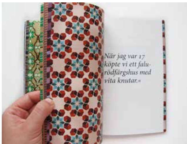
Ur boken Men ni iranier är ju bra på mönster- och andra berättelser om svenskhet av Sepidar Hosseini.