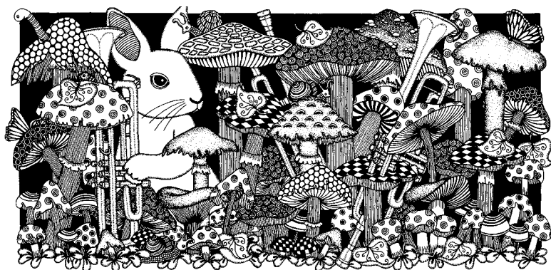
Illustration: Lisa Wool-Rim Sjöberg

Wahlström. Tapetmotiven finns till försäljning hos Photowall under kollektionen Wallpaper Stories. Alla inskickade bidrag finns publicerade tillsammans med vinnarna och information på Wallpaperstories.se . Tävlingskriterierna har satts utifrån Svenska Tecknares praxis för rekommenderade tävlingsvillkor. Juryn har premierat bildskapande, och bidragen har varit anonyma inför juryn, och därmed bedömts objektivt.